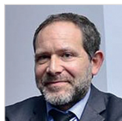
AUTEUR Colas Amblard TITRE Chargé d'enseignement à l'université Jean-Moulin, Lyon-III, docteur en droit et avocat associé, cabinet d'avocats NPS consulting

Dans nos précédentes publications, deux commentaires successifs 1 sont venus présenter une réactualisation du BOFiP-impôts intervenue le 4 novembre 2015 et portant sur le régime de TVA relative aux prestations de services rendus par les associations à leurs membres 2 . Des précisions s'imposent après interrogation du ministère de l'Économie et des Finances.